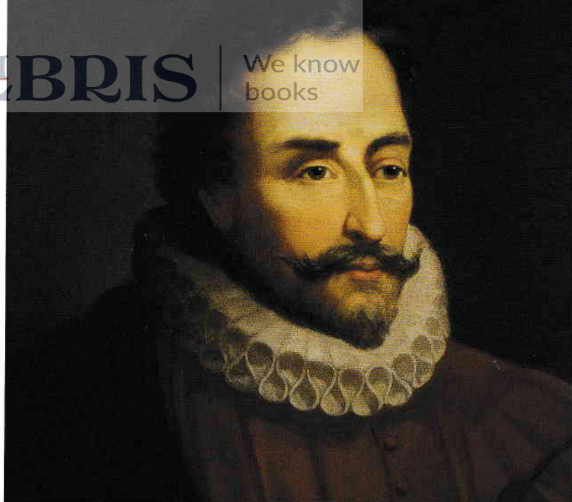
Miguel de Cervantes Saavedra (1547-1616).